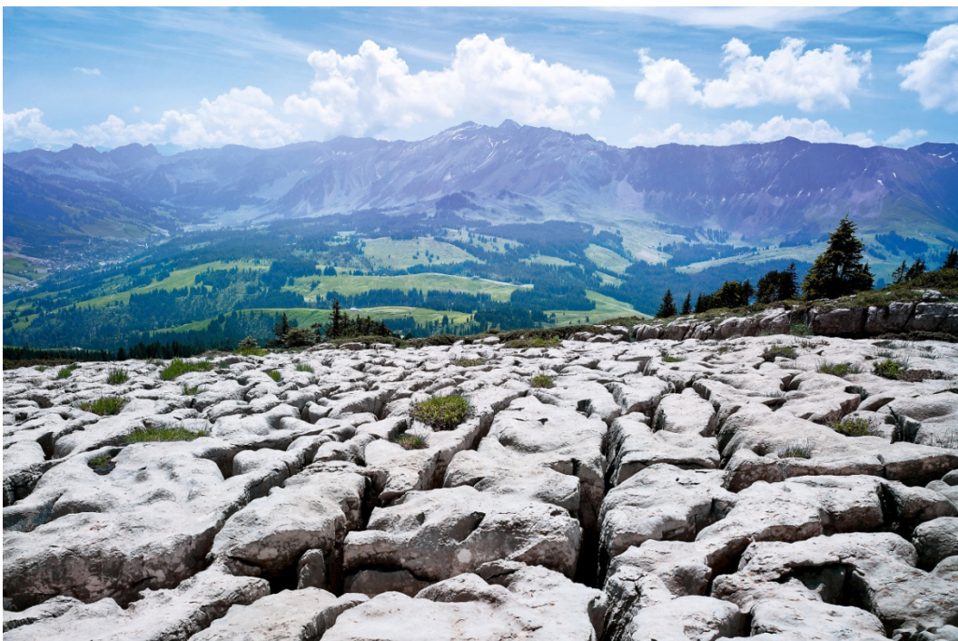
Biosphère UNESCO d'Entlebuch. Schrattenfluh. Vue sur la région de Sörenberg, jusqu'à la chaîne du Briener Rothorn.