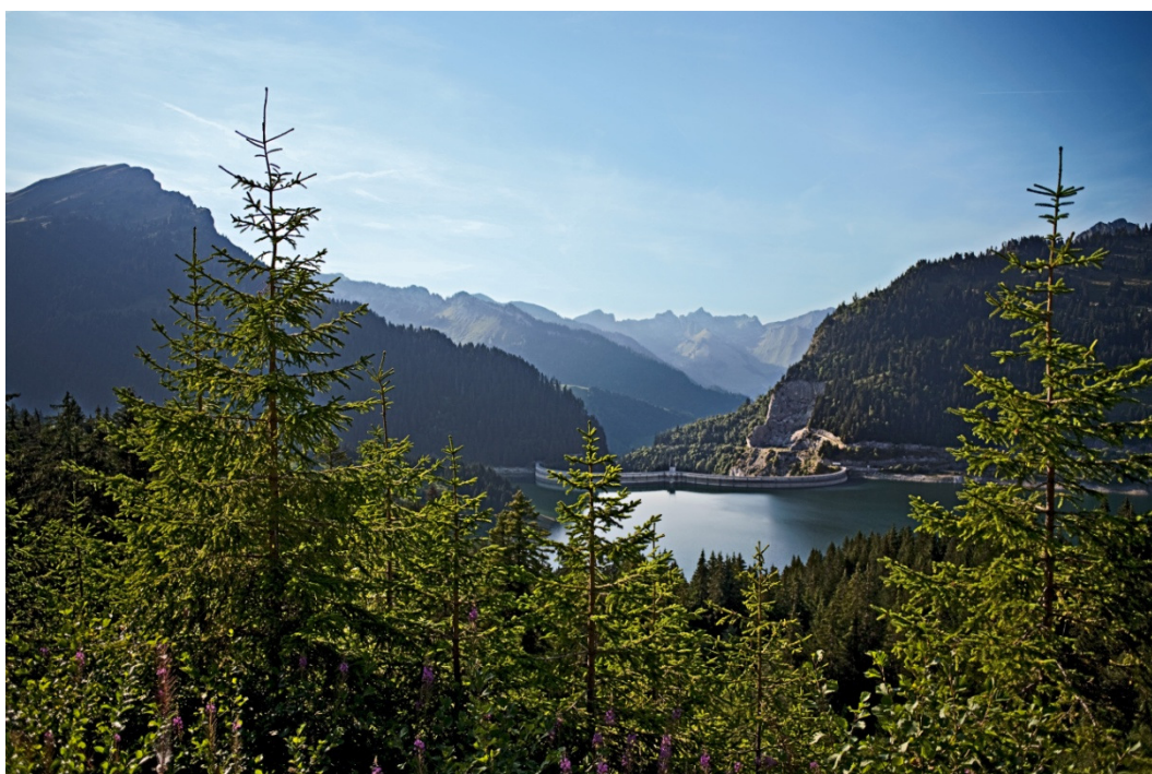
Parc naturel régional Gruyère Pays-d'Enhaut. Lac de l'Hongrin à 1255 m.